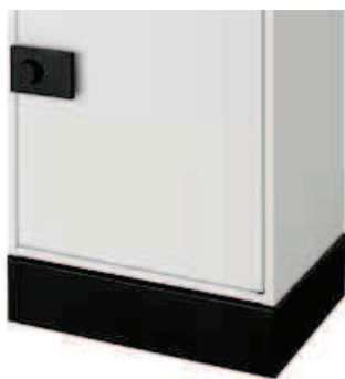
据置仕様 : ベース色 ブラック (エンボス調) 材質/高耐食溶融めっき鋼板