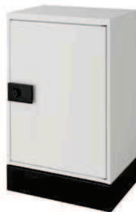
据置仕様 スタンダード