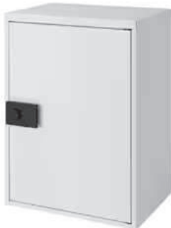
プレーンホワイト (エンボス調) 材質/めっき鋼板