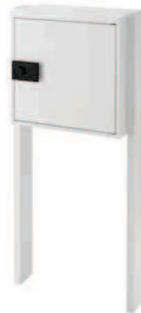
ポール仕様 コンパクト