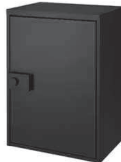
ブラック (エンボス調) 材質/めっき鋼板