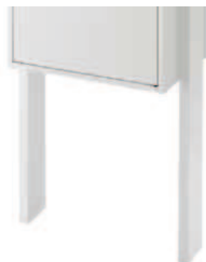
ポール仕様 : ポール色 プレーンホワイト (エンボス調) シャイングレー ブラック (エンボス調) 材質/アルミ形材