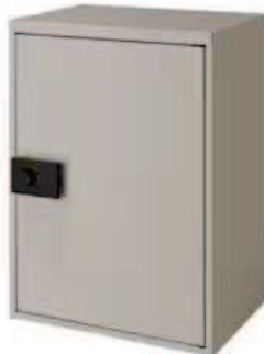
シャイングレー 材質/めっき鋼板