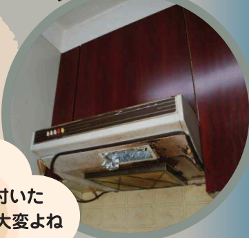
古い汚れたレンジフード